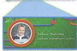
Tapa personalizada El retrato y el nombre de tu hijo impresos en la tapa.