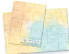
Inserción del autógrafo* ¡Una excelente manera de compartir mensajes con los amigos!

A great way to share messages with friends!