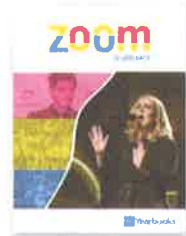
Zoom: Volante de los eventos actuales* Las novedades y las noticias de deportes y entretenimientos más memorables del año

The year's most memorable news, sports and entertainment news.