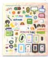
Adhesivos del anuario ¡Una excelente manera de compartir mensajes para personalizar las páginas del anuario

Vibrant, removable stickers to personalize yearbook pages.